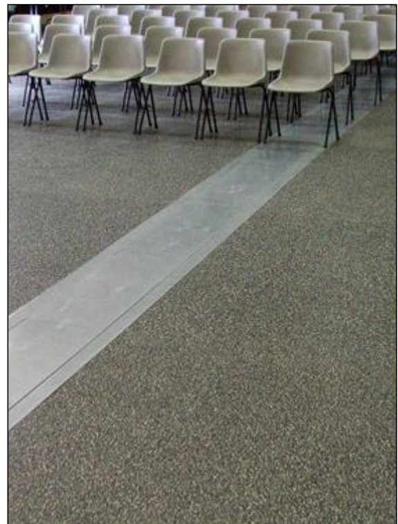
Caniveau technique pour le passage des câbles