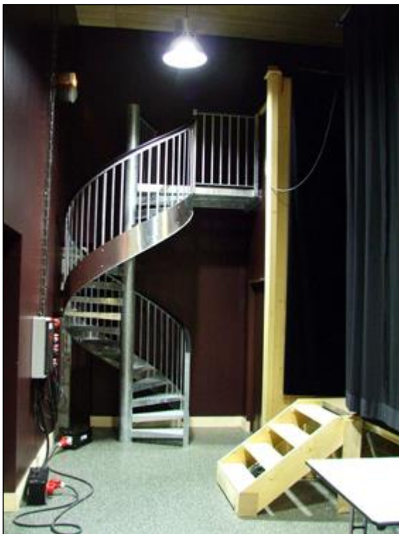
Accès étage loge par escalier colimaçon