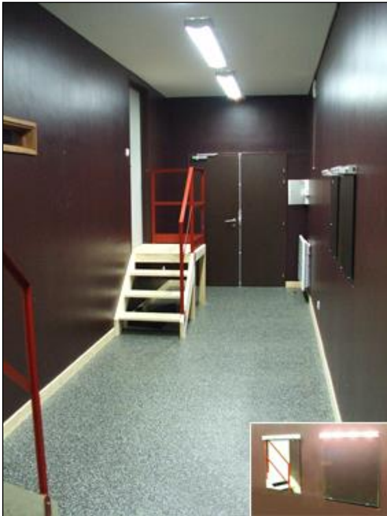
La loge de 20m2 avec accès scène – Miroirs