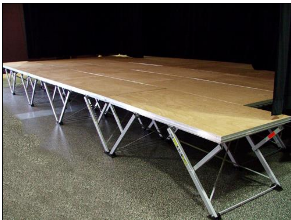
La scène modulable 9m x 5m x 0,80m